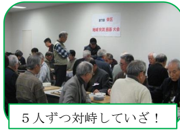
5人ずつ対峙していざ!

今や大人気の地域交流囲碁大会が、1月12日開催された。今年の幕開けに相応しく区内各地区より囲碁愛好会や囲碁クラブなど<24チーム>が集結し熱戦を繰り広げた。大会終了後は懇親会で、さらに交流の輪が広がった。