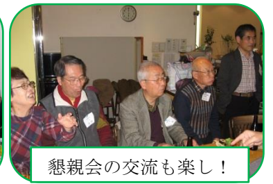
懇親会の交流も楽し!