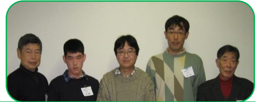
<Aブロック>優勝:本郷台囲碁クラブ F