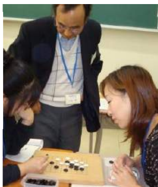
三世代地域交流会・ 囲碁教室風景