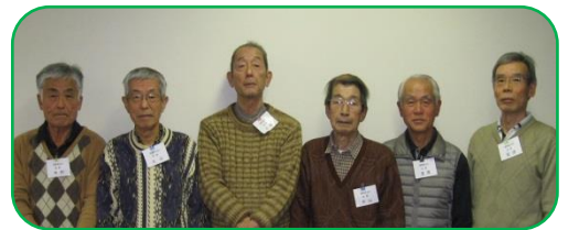
<Bブロック>優勝:湘南桂台囲碁愛好会 A