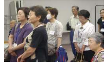
大会参加のペアの皆さん ↓