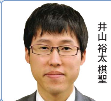
井山 裕太 棋聖