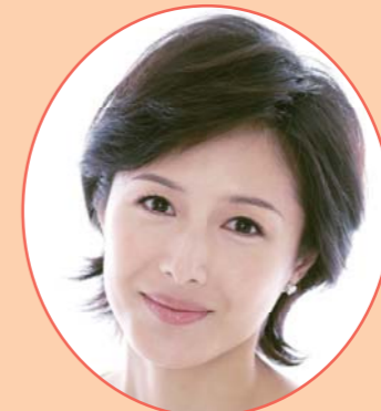
女優 水野 真紀