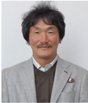
二十五世本因坊治勲