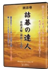
PCE535 詰碁の達人 有段者編 (CD1巻付)