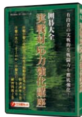
PCE532 実戦対応力強化講座 (CD8巻セット)