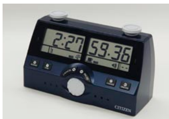
172A シチズンザ・名人戦 (10.6×18.0×7.2cm 約410g電池含む)