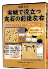
PCE531 実戦で役立つ定石の 前後左右(CD5巻セット)