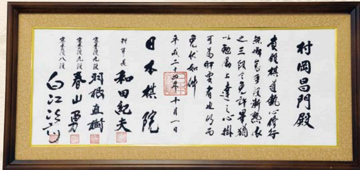
181A 桜材高級仕上免状額

性質：木理は通直で均質、狂いが少なく、耐久性が良い。 仕上げ：紫檀調塗装 布：紺色京緞子貼 前面：アクリル板 実寸：幅75.4×高さ35.4cm