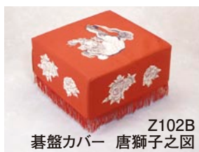
Z102B 碁盤カバー 唐獅子之図