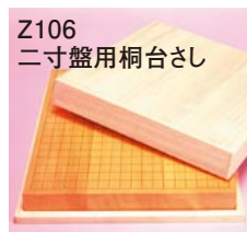
Z106 二寸盤用桐台さし