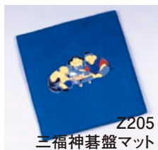
Z205 三福神碁盤マット