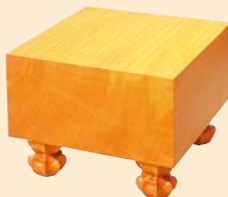
かや まさめばん 楯 柾目盤

碁盤に最も適した木材は、なんとと言っても楯(かや)で、右に出るものではありません。ほど良い弾力性、美しい木目と色艶、そして芳しい香を持ち、しかも使い込むうちに渋みのある餡色になります。その国内産の楯も原木は非常に少なくなっており、特に柾目盤は希少価値があります。ご予算やお好みをご一報くだされば、しかるべき楯盤をご案内いたします。お気軽にお問い合わせください。楯足付盤はすべて布覆、桐覆付です。