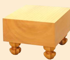
かや いためきうらばん 楯 板目木裏盤

価格例(目安として) 六寸柾目盤 150~500万円 五寸柾目盤 80~400万円