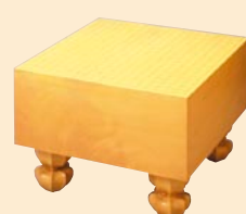
かや いためきおもてばん 楯 板目木表盤

価格例(目安として) 四寸板目盤 20~60万円 五寸板目盤 30~100万円 六寸板目盤 40~200万円