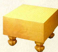
かや いためきおもてばん 榧 板目木表盤

価格例 四寸板目盤 20~50万円 五寸板目盤 30~100万円 六寸板目盤 40~180万円