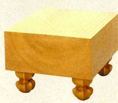
かや いためきうらばん 榧 板目木裏盤