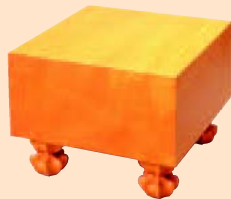
かや まさめばん 榧 柾目盤

ご予算やお好みをご一報くだされば、しかるべき榧盤をご案内いたします。お気軽にお問い合わせください。榧足付盤はすべて布覆、桐覆付です。