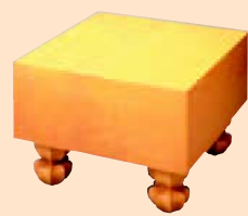
かやいためきおもてばん 榧 板目木表盤

価格例 四寸板目盤 20~50万円 五寸板目盤 30~100万円 六寸板目盤 40~180万円