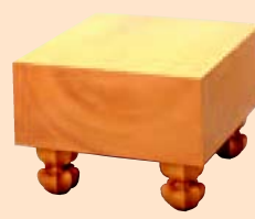
かや いためきうらばん 榧 板目木裏盤